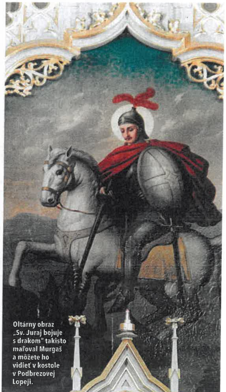
Oltárny obraz „Sv. Juraj bojuje s drakom“ takisto maľoval Murgáš a môžete ho vidieť v kostole v Podbrezovej Lopeji.