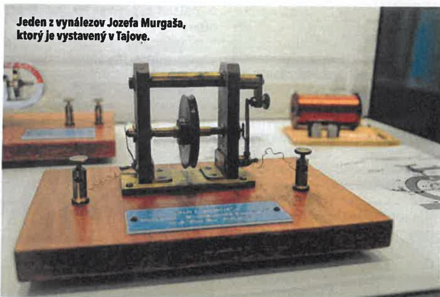
Jeden z vynálezov Jozefa Murgaša, ktorý je vystavený v Tajove.