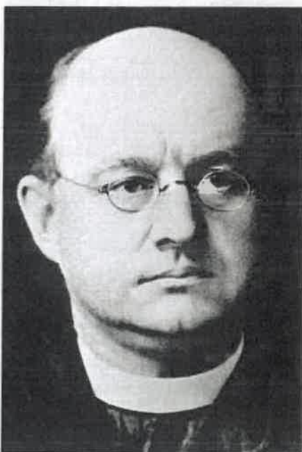
▲ Asi najpublikovanejší portrét Jozefa Murgaša.

Pre mňa bol živou bytosťou, nie len nejakou postavou z kníh. V rodine sa o ňom rozprávalo často, o jeho vášni