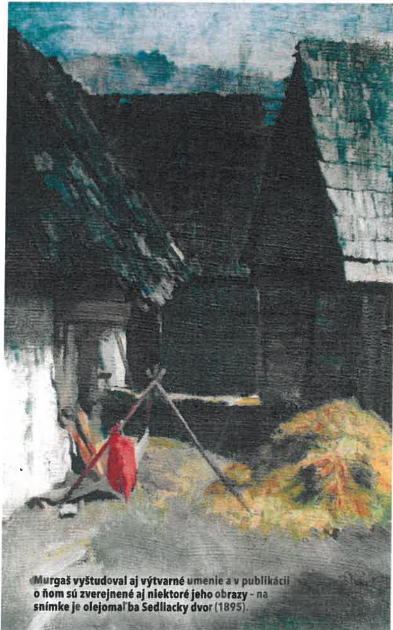
Murgáš vyštudoval aj výtvarné umenie a v publikácii o ňom sú zverejnené aj niektoré jeho obrazy - na snímke je olejomalba Sedlacky dvor (1895).

Keď v zámorí stavali školu, tak staval s nimi, chodil na ryby, na motýle, mal krásnu zbierku motýľov. Na základe toho si myslím, že bol všestranný, nielen v kostole, v dielni pri prístro-