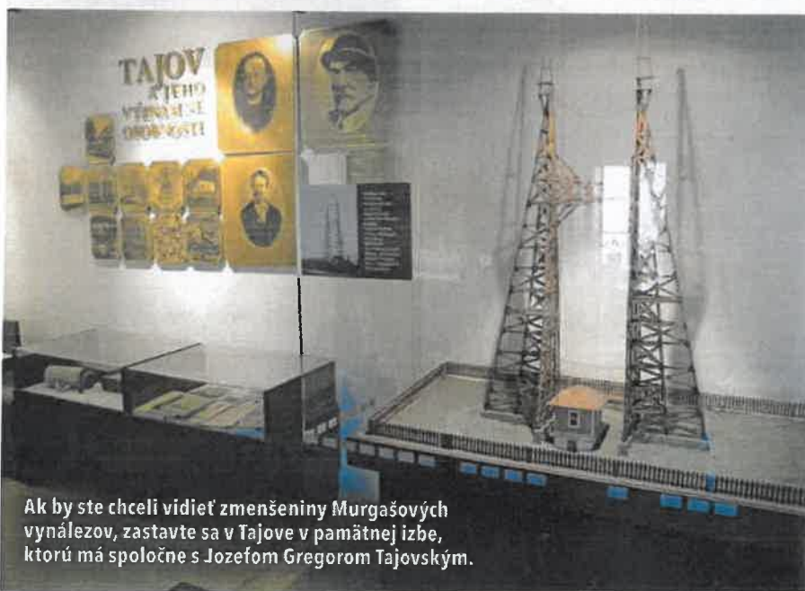
Ak by ste chceli vidieť zmenšeniny Murgašových vynálezov, zastavte sa v Tajove v pamätnej izbe, ktorú má spoločne s Jozefom Gregorom Tajovským.