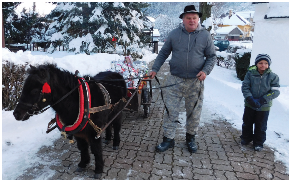
Mikulášske darčeky priviezol poník