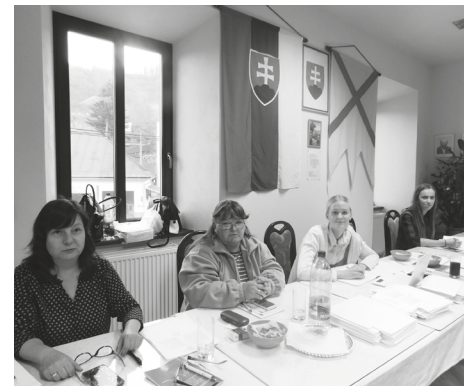
Členovia volebnej komisie dbali na bezproblémový priebeh volieb

Zvýraznený kandidát bol zvolený za predsedu BBSK.