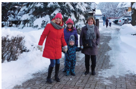
Na privítanie Mikuláša v kostole prichádzali celé rodiny