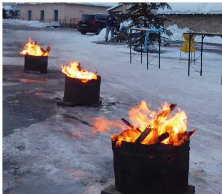
Na Placi všetko pripravené na privítanie Mikuláša a detí

Mikulášku, dobrý strýčku. modlím sa ti modlitbičku, zlož tú svoju plnú tašku, daj nám z darov tvojich trošku, či koláča mako-vého, či koníka medového. Aj túto pesničku zaspievali deti v Tajove Mikulášovi, ktorý sa najskôr zastavil v kostole, kde sa prihovril deťom. Ako poďakovanie pre Mikuláša si deti z materskej školy pripravili krátky vianočný program z vianočných kolied a básničiek. Potom Mikuláš v sprievode anjela, nezbedných čertov a veľa tešiacich sa detí prešiel na obecné námestie. Tu im porozdával darčeky, ktoré mu na voze priviezol poník. Keď už boli všetky darčeky rozdané, Mikuláš rozsvietil stromček. Okrem dobrôt, ktoré mali deti v balíčkoch, mohli si pochutiť aj na vafloch so šlahačkou a čokoládou a teplom čajom. Mikuláš sa rozlúčil so sľubom, že príde aj na budúci rok.