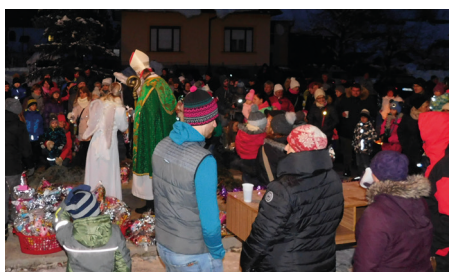
Mikuláš s anjelom majú čo robiť, čaká ich plné námestíčko