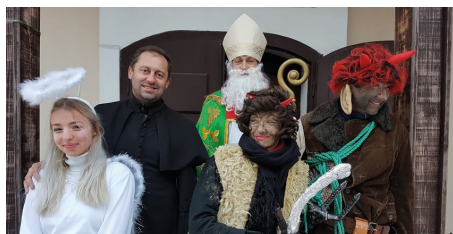
Všetci sú pripravení, Mikuláš môže začať