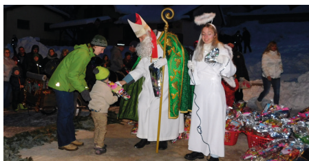
Balíček je skoro väčší ako deti