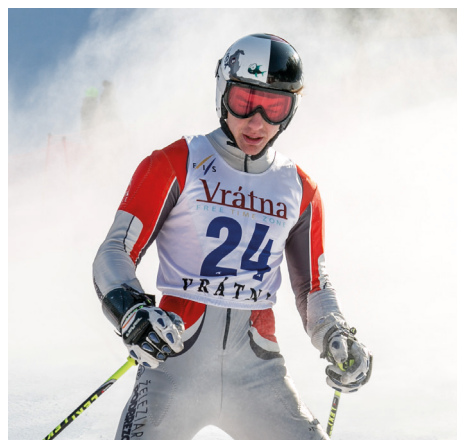
SKI INTERKRITÉRIUM Vrátna

Najlepšie výsledky som dosiahol tohto roku v januári vo Vrátnej na medzinárodných žiackych pretekoch Interkritérium Vrátna 2017, kde v kategórii U16 som vyhral obe disciplíny: slalom aj obrovský slalom. V Slovenskom pohári v slalome a obrovskom slalome dosahujem pódiové umiestnenia v oboch, alebo aspoň v jednej disciplíne. Za úspech považujem aj 9. miesto na medzinárodných pretekoch vo francúzskom Val d'Isere, ktorým som splnil kritériá pre zaradenie do reprezentačného družstva do 21 rokov. Teraz sa snažím získať čo najlepšie FIS body (počítajú sa z umiestnenia na pretekoch), ktoré sú rozhodujúce na zaradenie do reprezentácie na ďalšiu sezónu.