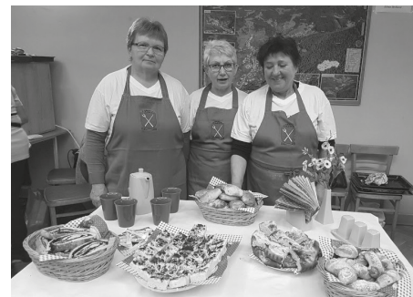
Pečenie kysnutých koláčov

Dňa 11.11.2017 sa v Riečke uskutočnilo tradičné pečenie kysnutých koláčov. O 14:00 hod. sa súťaž rozbehla a pokračovala vo veľkom tempe. Neverili by ste, za akú krátku dobu sa dá upiecť toľko druhov kysnutých koláčov. Popri tom zatiaľ prebiehala ochut-